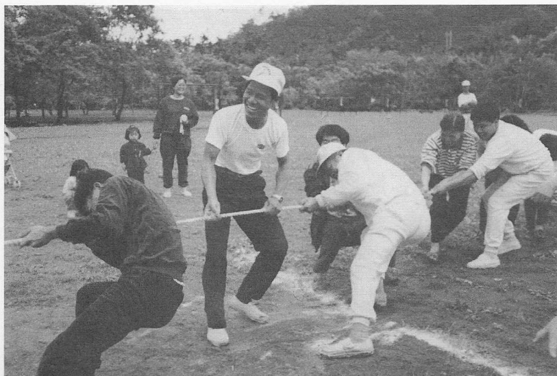
△拔河比賽—使盡渾身解數。

葉，湖光山色，綠草如茵的鯉魚潭，更顯得詩情畫意。今天有這樣秋高氣爽，可謂「天涼好個秋」的好天氣，來舉辦戶外聯誼活動，可說是「人有善願，天必從之」。之最佳寫照。在晨風徐徐，輕煙微雲的