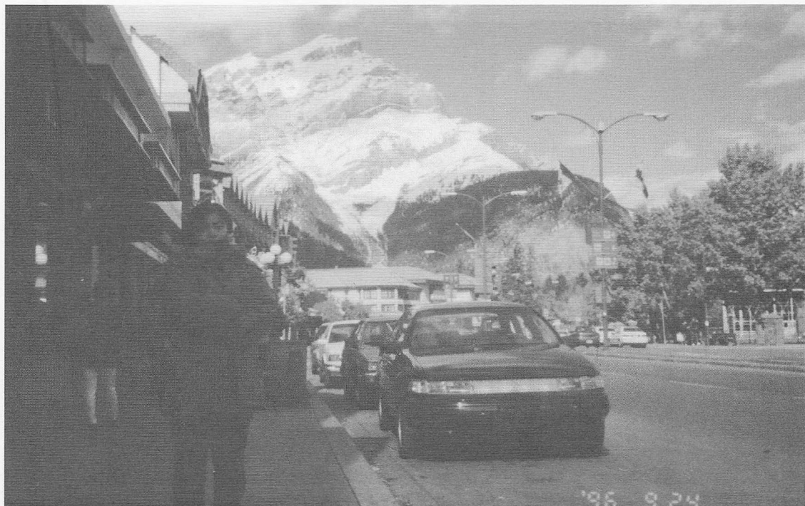
△卡加利班英國家公園一景。

傳師介紹之下，始知這是基礎組在香港的蘇老前人來此開荒所創立。談到道務的種種，林點傳師說到：「傳道之不易，由於身在異國，國情、風俗不同，思想、理念各異，所以傳道之困難重重，即使是由東方各地遷移加國的華人也是有許許多多的問題存在。即使有再大的困難也要一一克服，老中會有安排的。」她誠懇的一番勉勵話語，和親切的招待，真是教後學們深深感動。國外的道場與台灣有許多不同之處，要宏揚道務，確實要全身全心投入、又不拔的毅力和對道充滿信心才能堅持下去，每逢國內（台灣）有點傳師、道親們遠來助道，必能振奮士氣，給當地開荒的前賢們打了一劑強心針，再接再厲勇往直前。 道務不是三、五年的事，是千秋大業、永續不斷的。在