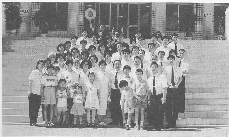
△一行人於天惠道院與黃點傳師（第二排左二）合影。

八十五年六月三十日是天定堂培德班和新民班訪道的日子，由於去年曾經參觀過全真道院、中一堂及天德堂，不但讓新道親們開拓視野，也讓他們感受到一貫道場的活力及熱情，進而法喜充滿，道心堅定。所以今年再籌畫，遠訪彰化