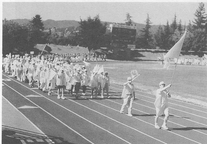
△同心協力，氣勢如虹。