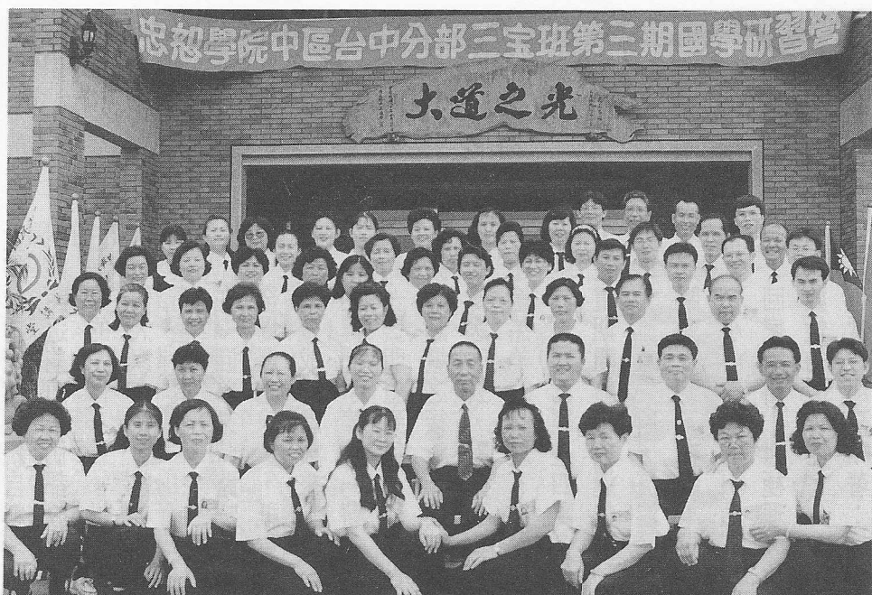
△於天華講堂參加法會的台中分部三寶班學員合影。

活生生的例子。早在民國七十九年間，她忽感全身不對勁，住進台北三軍總醫院，經數月的診治未見好轉，反而病情加重，據醫生告知：家母所得的是頸部第三節骨患了「骨癌」，乍聽之下，有如晴天霹靂，這突如其來的消息震得我們身為子女者躲在廁所的一角哀傷的哭泣著……不敢讓家母知道。就在這當下理智告訴我：別再傷心，快祈求老師慈悲，多加幫忙，使貴人早日出現鼎力相救。道親之中忽然有一位「老前賢開金口說：快轉院，轉到「林口長庚醫院」。即刻辦出院手續叫來救護車火速的轉入，安頓好之後，家母接受著種種的測試檢查，看她皮肉의 煎熬，痛苦的呻吟不是她這種年齡所能忍受的，看在眼裏，痛在心坎的深處有如刀割，真恨不得我能代家母受苦。