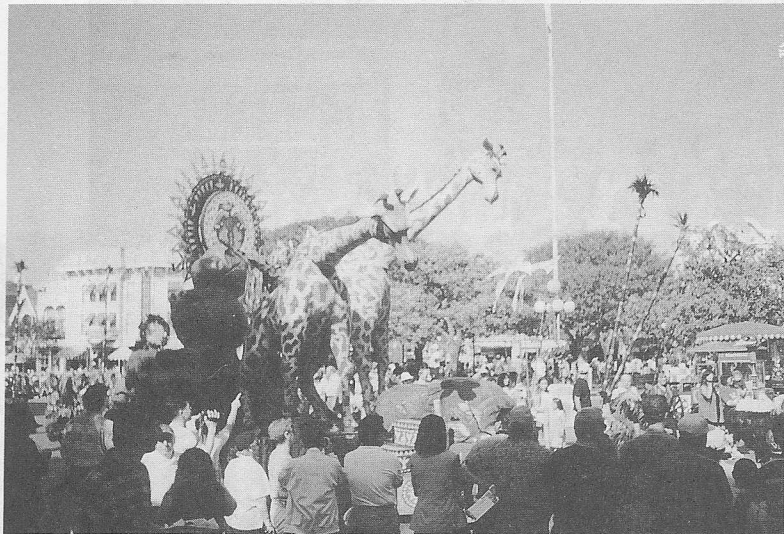
△歡樂與夢想的世界—狄斯耐樂園。