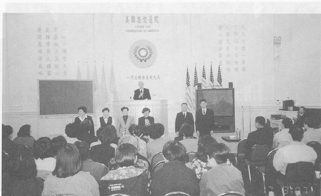
△舊金山美國忠恕道院法會一景。

將一件件厚厚的上衣外套借給了我們，從此覺得無比的暖和，往後幾天在舊金山期間，再也不會再有寒風刺骨了，說也奇怪要離開舊金山的當天，氣溫反覺暖和起來。當天十五日傍晚時刻順便到舊金山郊區（灣區）暢遊觀賞景色，也遊覽了金門大橋，其雄偉壯觀的懸吊式建築，令人嘆為觀止。