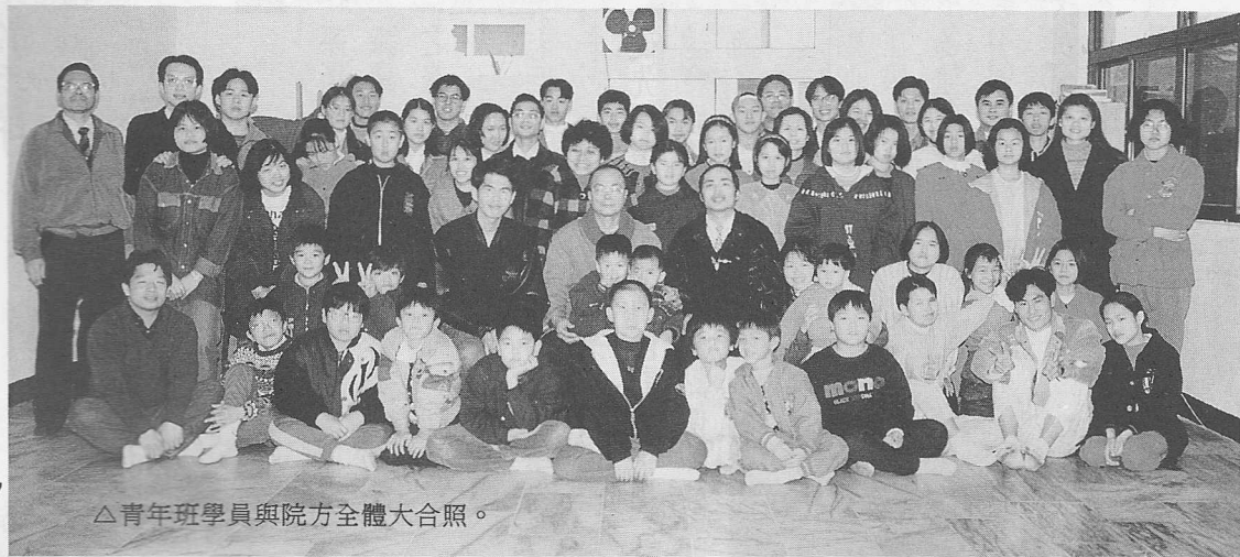
△青年班學員與院方全體大合照。

院中收容的孩子，從最多時的七十人，至目前的十七人，院長辦公廳狹小的一面牆上，掛滿了大大小小來訪人士所留下的紀念牌，數十年的心血投注，全部歷歷在目。有人問院長：「資金來源？夠不夠用？」院長則回答：「需要錢的時候，上天自然會安排，解決我們的困難。」身為一貫弟子的您，聽了是否也同樣會心一笑？有形的物質也許偶而會短缺，但在院長的身上，我看到了永不枯竭的「愛心之泉」。