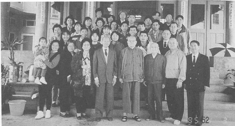
△與汪前人（前排右四）、顧前人（前排右三）攝於大光寺前。