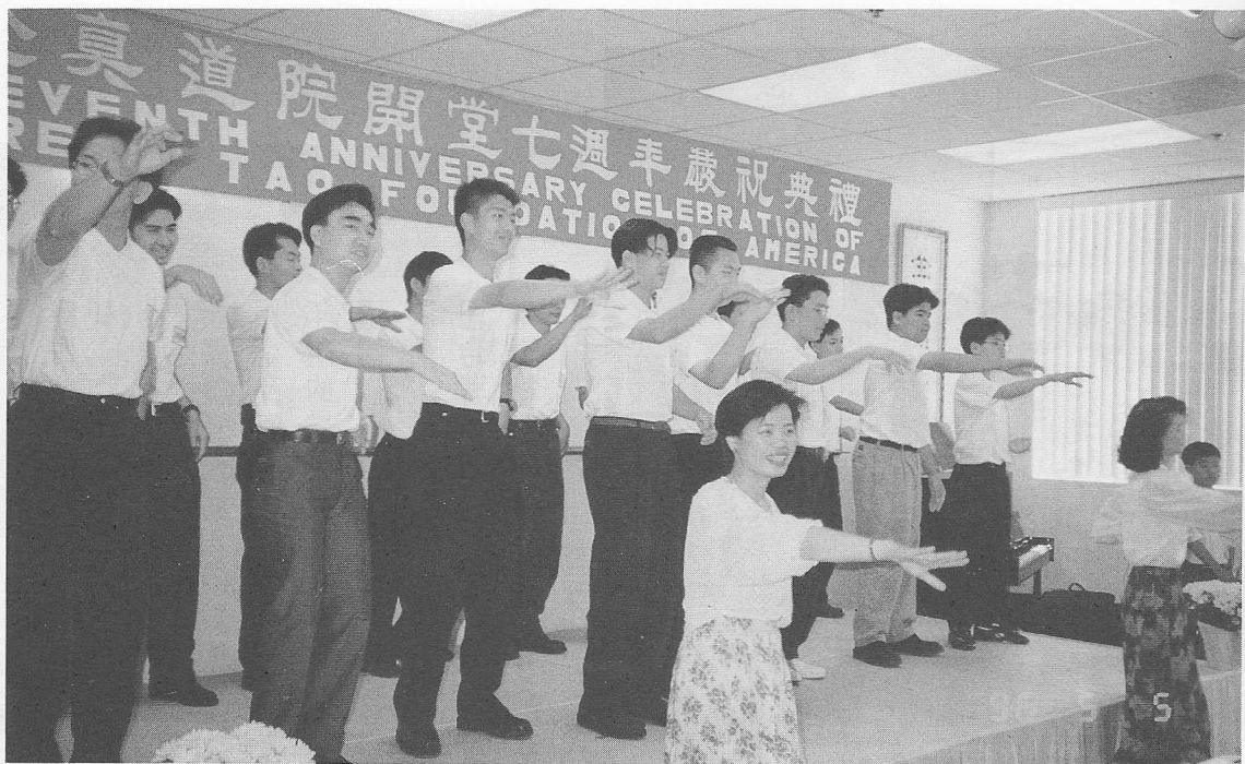
△青少年組的演出，精彩絕倫。

奏，民俗技藝、電子琴演奏、喇叭獨奏，非常精彩，由於篇幅有限，不克一一敘述。總之個人表演水準極高，演奏技巧反應出全真道院人才濟濟，一貫道弟子真是「十八般武藝樣樣齊全」。