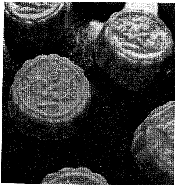
△月餅是中秋節應景的主角之一