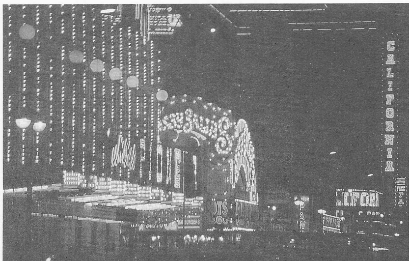
△拉斯維加斯的賭場，似乎是在考驗人的定力。

就是拉斯維加斯，對一個修道人而言，在賭城可真是在考驗定力，觸目所及的都是賭，因為飯店一樓就有賭場。聽到別人贏了叮叮噹噹的掉錢聲，少有人不動心想去試試運氣，後學認為入境要隨俗，來到賭城