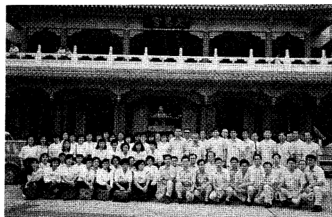
◀ 正義精修班 經典組同學 天恩宮前合影 留念