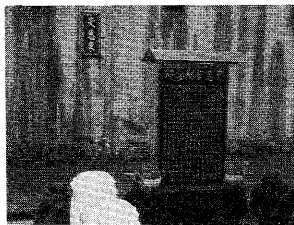
▶ 道親的誠心 ——上天的慈悲 ——天恩泉

是每個人圓滿自己的職位，以便圓滿的回去，向上天有所交待。張老前人幫助所有前人，我們亦應步其後塵，以幫助他人爲己任，『道可道，非常道』，道必須要做，才傳得開來。」由此可見，我們的責任是何等的重大與神聖，有太多的工作等著我們去做，希望大家伸出雙手，邁開腳步，現在馬上去做，讓基礎道務更蓬勃發展，使更多的人得沾天恩。