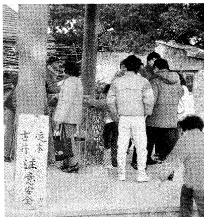
▷ 傳說中的這口古井，裏面還有最後一根木頭浮在水面，引來不少遊客