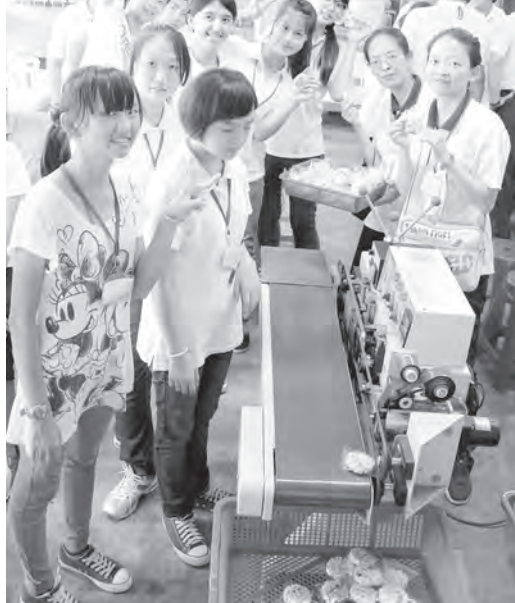
▲ 同學們最期待的米香 DIY 體驗課程。

服務完之後，就進生服營課堂中，一起進行「做自己」課程，透過賓果遊戲和心理測驗，讓同學了解到社會我、理想我與本質我的不同，並且學習從認識自我到肯定自我，進而發揮自己的特質，以服務人群。其中，「願意繞他兩圈，對他說我喜歡你的人」