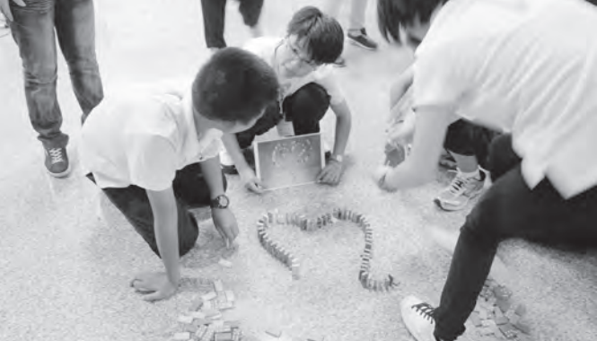
▲ 排骨牌，考驗小組的團隊默契。

一個不小心，手或腳去碰倒了，牽一髮而動全身，又必須重新排起；如果聽到慘叫聲，就可以知道有哪一隊又粗心弄倒了骨牌。