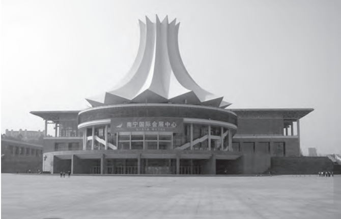
▲ 佔地廣闊的國際會展中心。