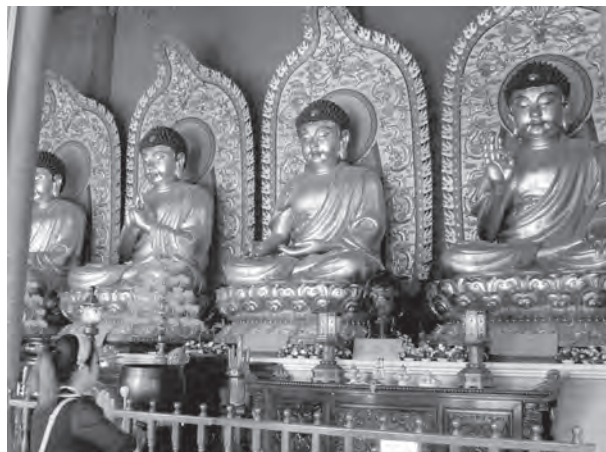
▲ 參拜廟中莊嚴佛祖。

行走間，遇到當地電力公司配線工程人員正在施工，市區中的人行道很寬，管路都設在人行道下，施工並不影響車流。與工程人員聊天得知，廣西河川水流量很大，故以水力發電為主，唯一缺點是冬季時水量較小。這位工程人員年約 50 歲，育有一子；在電力公司（皆是公營）年資已超過 25 年，目前月薪 4.8K 人民幣，已有兩間房子；55 歲可退休，其退休金換算與台電人員差不多。