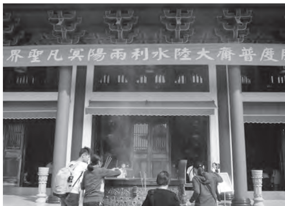
▲ 適逢水陸法會，香火鼎盛。