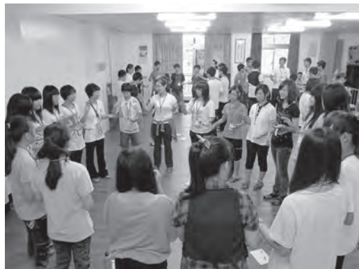
▲ 學員團體活動一景。

第四單元「轉念」：第二天的轉念課程，讓學員瞭解為何要轉念及轉念的好處，並告訴學員如何轉念，同時帶領小組玩「轉念的遊戲」。由於經過一天的活動，第二天學員彼此間的互動已漸入佳境，討論得非常熱烈，不管任何情境，都能有正面的思