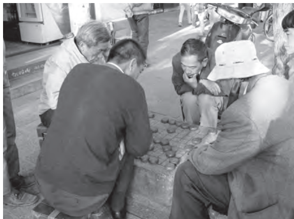
▲ 石桌棋盤，走一局吧！