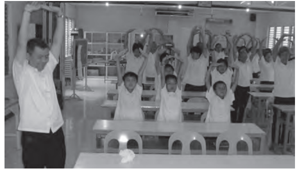
▲ 八段錦養生操舒筋提神。

課程講完，接下來就是心得報告。菲律賓學員都搶著講他們的心得，聽完報告，後學想一想，他們真的有得到與學到很多道理，而且都有應用在日常生活上；脾氣毛病也改了很多，所以從心得迴響中，後學體會到——不管聽了幾年的道理，或者聽了幾次重覆的課程、道義，總有一天會真正的聽