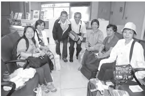
▲ 張點傳師(右三)領隊於候機室合照。

奉道，其道甚大。」(註1)知之而行，知行合一。知之真切篤實處即是行，行之明覺精察處即是知(註2)。後學發心如初，帶著簡單的心、簡單的志，一切從零開始學習，堅定我心，才促成此行，後學就這樣踏上這趟泰國使願之旅。