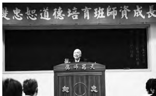
▲ 黃老點傳師講述老前人行誼。