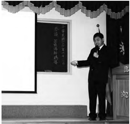
▲ 呂聯富點傳師「感恩與懺悔」專題。

進入道門之後，師尊、師母二老大人為眾徒兒立下了必修功課，在每日燒香中，借跪讀「愿懺文」來洗滌一天的心垢。還有月懺、年終總懺、和前人慈悲為後學們設立的「懺悔班」等等，讓修學者經由懺悔的法水，洗淨業障帶給我們的煩惱痛苦，能得清淨解脫。詩曰：「莫作惡因學