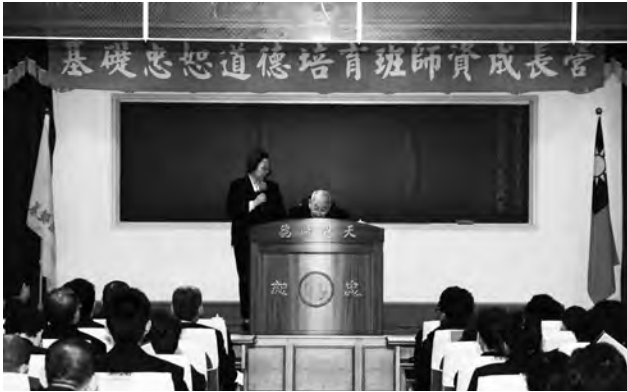
▲ 恭請袁前人慈悲賜導。