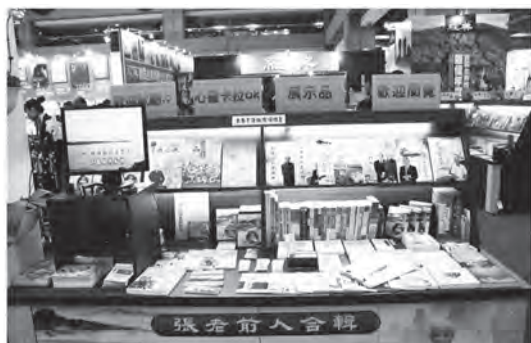
▲ 基礎展位推出老前人合輯特展。

不丹國家館旁邊），展示區設置圖文和影片，讓參觀民眾了解一貫道的教育文化、生活藝術、慈善公益等內涵。尤其，特別將多年來致力於推廣全民讀經的過程與成果，與全國民眾分享。銷售區由各出版社展售紙本和影音出版品：包含各類道義教材、傳承文化、生活經驗與智慧資產等書籍。參觀民眾及道親購書踴躍，並有許多外國民眾來參觀，風評頗佳，都認為一貫道展位在書展會場中，陳設清新，有別於其他出版社和書局，且