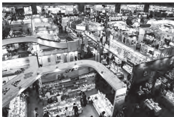
▲ 台北國際書展鳥瞰圖。