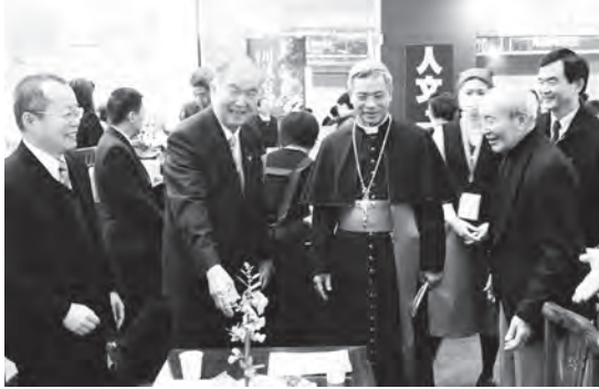
▲ 天主教洪山川總主教前來祝賀。

服務人員解說非常親切，整體看來是最有氣質的展位，散發清幽氛圍，令人印象深刻而美好。很多參觀者跟我們說：「我看過了所有的展場，就是你們一貫道最有氣質！」令我們聽了很感動的！基督教賢達與天主教洪山川總主教一行特來參觀一貫道展位，大方地給予祝福與讚美，感恩宗教界前輩前來祝賀交流，相談甚歡，「以書會友」，共融共和。