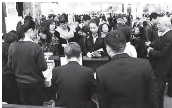
▲ 外國民眾參觀購書踴躍。

不丹國家館旁邊），展示區設置圖文和影片，讓參觀民眾了解一貫道的教育文化、生活藝術、慈善公益等內涵。尤其，特別將多年來致力於推廣全民讀經的過程與成果，與全國民眾分享。銷售區由各出版社展售紙本和影音出版品：包含各類道義教材、傳承文化、生活經驗與智慧資產等書籍。參觀民眾及道親購書踴躍，並有許多外國民眾來參觀，風評頗佳，都認為一貫道展位在書展會場中，陳設清新，有別於其他出版社和書局，且