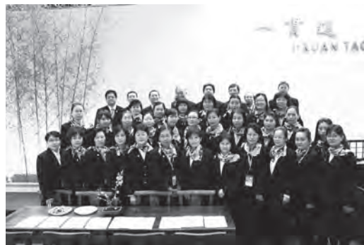
▲ 服務接待人員展現高優質形象。

均能表現出白陽弟子的修辦精神，以彰顯一貫道的高優質形象。服務人員佩帶的男用（乾道）領帶及女用（坤道）絲巾，穩重大方且活潑亮麗，帶給民眾相當好感，特別感謝安東道場前賢慈悲製作、提供。天恩師德加被，經過各單位共同努力，終於圓滿完成，服務道親參與感受，有這麼好的了愿機會、與各組線道親文化交流，又可一次見到諸多不同的道場出版作品、影音資料，感受法喜充滿。