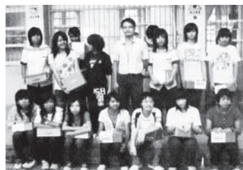
▲ 六龜高中運動鞋補助男、女生合照。