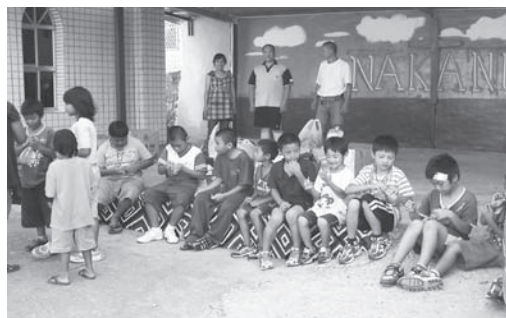
▲ 送愛到部落，大家一起來。