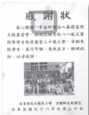
▲ 高士國小致贈感謝狀。