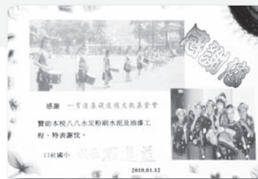
▲ 口社國小致贈感謝狀。