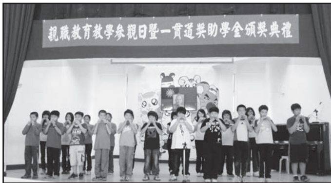
▲ 梅林國小各班陶笛比賽，班班精彩。