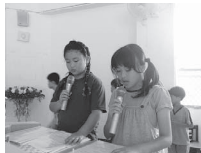
▲ 兩位可愛的主持人。

在步入會場途中，悠揚的樂音環繞整個園區，蘊含詞意，絲絲入扣，憾動大伙的心。剎那間，耳朵成了靈魂與天地宇宙溝通的唯一管道。如此純