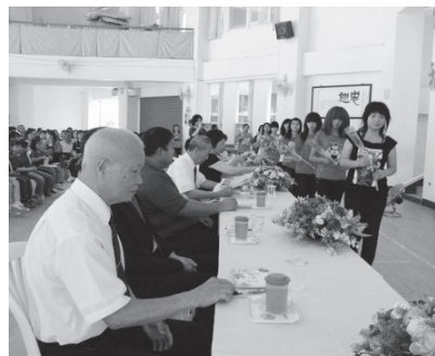
▲ 小朋友們獻花及感謝卡。