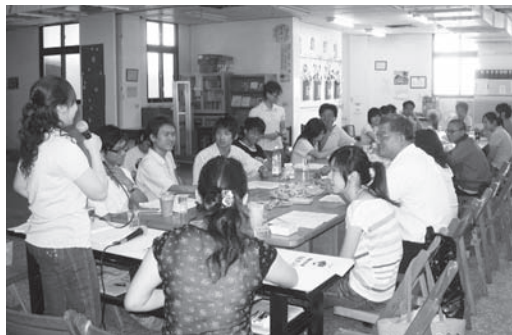
▲ 兒童夏令營小隊輔集訓。

你的走，讓我來不及反應，來不及再好好看看你、抱抱你，甚至親親你，你知道我是多麼不想放開你——因為你的懂事、你的體貼、你的孝心，