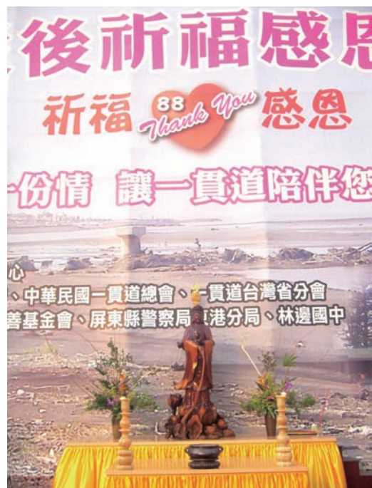
▲ 聞聲救苦救難的觀世音菩薩。

最後主辦單位以再出發這首歌作爲落幕，希望藉由這場祈福活動，讓受難者消災解厄，重見光明，讓罹難者靈安自在，永遠安息；願上蒼庇佑這群救難者福氣綿綿，平安健康。祈求上帝普降福祉，風調雨順，國泰民安，人心趨善，社會安祥，世界和平。