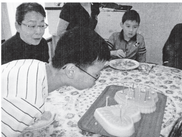
▲ 小朋友吹蠟燭，慶祝母親節。

「人人皆有佛性，人人皆有本心，只因分別執著，致使流浪紅塵。斷除世俗煩惱，放下執著之心，徹悟本心本性，即見自家光明！」讓孩子們自小就接近善知識，徹悟本心本性，將來才能斷除世俗煩惱，有好的健康成長，才能代代相續，將道傳播於世界。