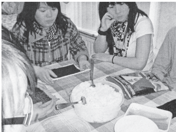
▲ 大朋友們學做壽司。