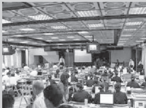
▲ 擁有現代化視訊設備的崇正道場。

由於後學們逾時抵達，參駕完後，隨即進入餐廳。高挑的廳舍、滿屋的飄香讓人垂涎三尺。因時間已是下午一點多，讓點傳師與前賢們跟著挨餓，心中無比歉疚。感恩寶光崇