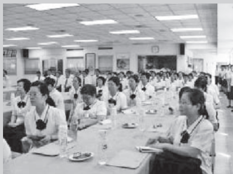
▲ 代表基礎忠恕參訪道場，精神抖擻。

值得再三探索、玩味、學習。謝領導點傳師講述宏宗聖堂道學院一麻雀雖小五臟俱全，秉持高老前人來台推動道務的精神，創辦宏宗聖堂道學院，讓修辦道的佛子「慈悲喜捨、頂劫救世、尊師重道、明道奧、闡道旨」早日將彌勒福音散播世界各地。又以「八大能量」勉勵前賢：「上天老中