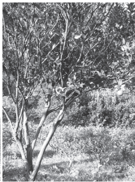
▲ 肖楠樹欣欣向榮、生生不息象徵大道宏展。