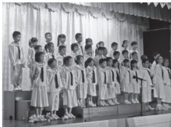
▲ 天慧兒童讀經班小朋友可愛的表演。

經由施點傳師慈悲親自主持開場，致上熱烈歡迎之意，並一一向大家介紹隨團十一位點傳師。歡迎晚會的序曲由「耀德聖樂組」獻上高山青、豐收鑼鼓兩首曲目，兩位青年才俊表演的「一言絕句」說相聲，「耀德兒童唱詩班」一張張可愛的臉孔，為我們帶來了問候歌、世界真細小、小毛驢與If you are happy，「耀德朗誦組」為我們帶來春風化雨點點滴滴，歌頌前人輩開荒播種，慈心悲願，含辛茹苦，點點滴滴均刻劃在後學們的心上，「青少年班」演出道風德範篇之邱公前人，後學們念念不忘感恩效法前人德行，最後，曾遠赴台