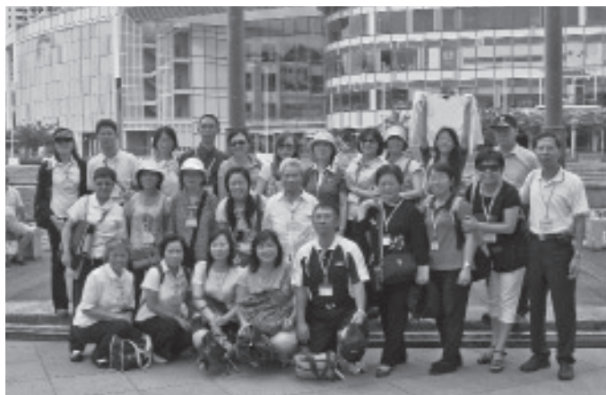
▲ 基礎忠恕團員合影。

謹以此文，紀念2008年一貫道總會台北市分會馬新道學觀摩之旅，並以此自勉，期許勿忘師恩母德，老前人、前人、點傳師慈悲栽培，賜與一條光明人生大道，未來後學定當盡力「學修行講辦」，以報天恩師德。