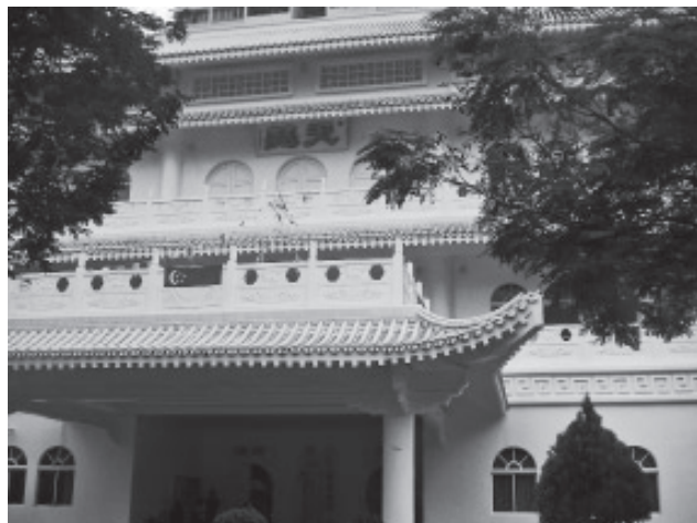
▲ 新加坡天慧佛堂外觀。

就在「胡姬花」這首悠揚的歌聲響起時，舞台前方出現了許多年輕美麗的面孔，手上端著新加坡的國花「胡姬花」別針，一一為我們來自台灣的道親別上，這一份盛情讓我們都非常感動，久久無法忘懷。離開天慧佛堂，新加坡前賢們點起了蠟燭，離情依依向我們一一道別，當我們上了車回頭望去，原來天慧佛堂各樓層每一處的前賢，都還在熱烈向我們揮