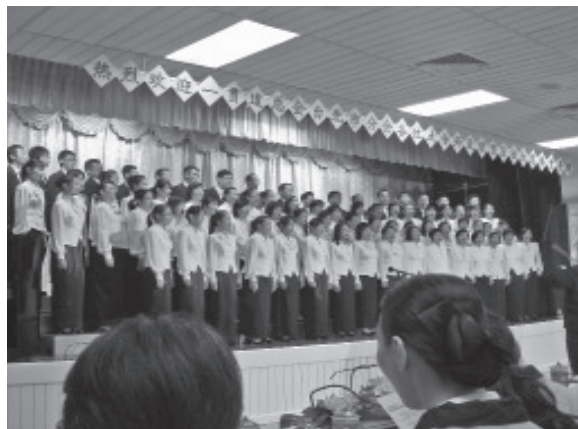
▲ 耀德聖詩合唱團曾到台灣表演。