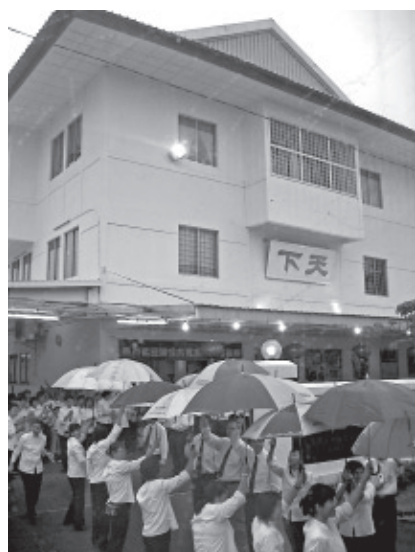
▲ 天下佛堂前的雨傘橋。