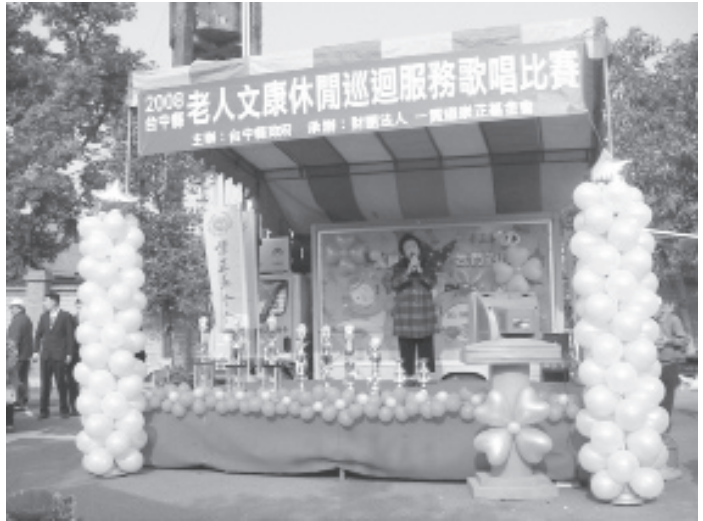
▲ 各鄉鎮的老人踴躍參加歌唱比賽。

巡迴，一年下來，每月服務達五、六十場。事前工作程序為：每月15日以前，與各村里長、志工團體、老人會、關懷據點等聯絡，並貼宣傳單在巡迴部落格、台中縣志工的家、公佈欄、大海報以告知。每服務車次平均動用志工5到8人，操作流程駕輕就熟，配合其他單位20到30人，配合醫院診所則有50到60人，最多一場有70到80位老人來參加（岡山地區），長者多需要鼓勵和關懷，最喜歡的是唱歌、推拿，活動能令他們快樂。