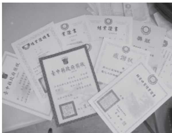
▲ 志工的學習與服務受到社會肯定。

多長輩來說，這是畢生重要而難忘的一天！一切歸功於各志工團體全力配合，平日服務成功的效應，因此再遠地方的老人也都由家人陪同前來參加盛會呢！