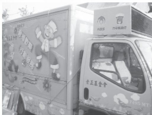
▲ 一貫道創造神奇歡樂的巡迴車。

由內政部指導、台中縣政府主辦、一貫道崇正基金會承辦（1996年11月成立，宗旨：從事社教工作，拯救貧乏心靈，利用廣播與電視媒體弘法，推展社會福利工作，積極從事各社會公益活動，密切配合政府推動各項政策：改善社會風氣、心靈改革政策，舉辦北中南「心靈昇華班」，已進入72期。）提升老人生活品質，