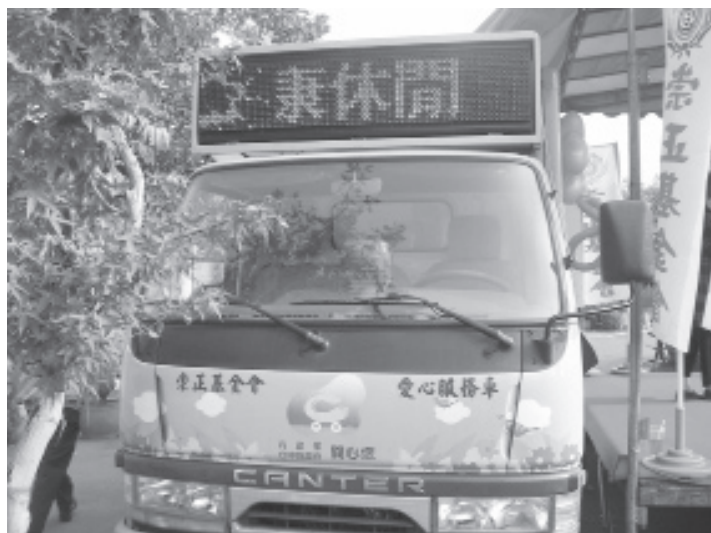
▲ 一貫道崇正基金會愛心服務穿越大街小巷。

我成長、增強年輕人欠缺的社會責任感，藉由服務及工作技巧，牽引更多青年參與志工服務，建立良好的社會價值觀。一貫道崇正巡迴車的內容含括廣泛：生活照顧、關懷問安、友善訪視、適應環境及人際關係等諮詢服務、心理輔導、醫療護理、衛生保健、防癌健康操，更增加多元化的：下棋、文藝、詩詞吟唱、話劇表演、園藝教學，讓老人更健康快樂的生活。