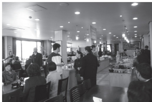
▲韓國特色素食BUFFET自助餐廳。

如大地般的無私，將小愛化成大愛！這種精神令人鼻酸、為之動容、十分感動，深深感受到張鳳蘭點傳師是如此大量、智慧、曉以大義！除了敬佩，羞愧心也由然而生，想想現在的我們擁有如此舒適、便利的道場，卻不知足的計較與埋怨著。