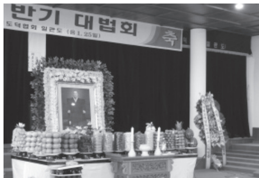
▲感恩祭拜慈明天君會堂。