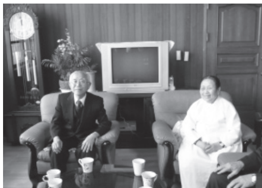
▲ 河前人(左)、白前人於接待室。

隔日，我們即動身前往扶餘繩墨法壇。參駕完後便與金老前人家屬一同爬上後山，參拜最上層的