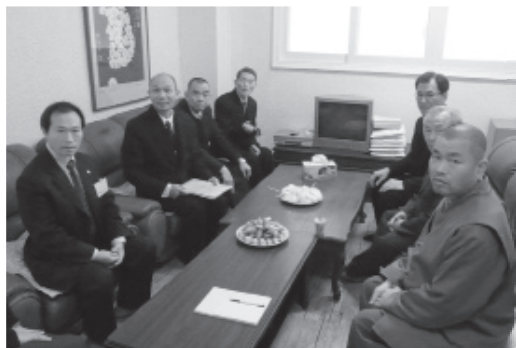
▲ 感恩慈悲！又相見歡！！

力十足！去年九月韓國道親來台參加師尊成道六十週年紀念大會，並參觀台灣各大道場。回國後便馬上著手進行，至2007年12月完工，短短不到幾個月的時間就成立如此完善的展示室，以供後人緬懷 金老前人。此一精神令人敬服外，也能看出 金老前人在韓國道親心中是如此受敬重尊崇； 金老前人在韓國是如何用心道化韓國道親，才有現今如此成果。其中更收藏 金老前人與 蘇老前人與 張老前人之間書信。