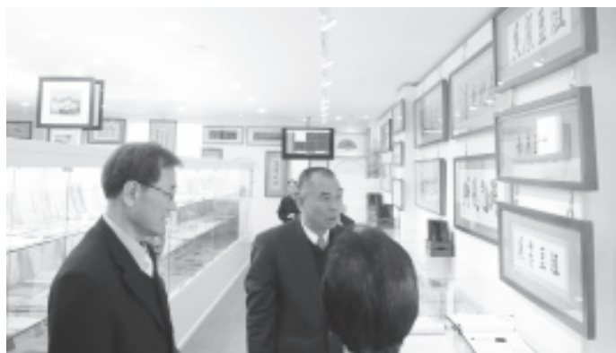
▲ 參觀收藏完善之展示室。

力十足！去年九月韓國道親來台參加師尊成道六十週年紀念大會，並參觀台灣各大道場。回國後便馬上著手進行，至2007年12月完工，短短不到幾個月的時間就成立如此完善的展示室，以供後人緬懷 金老前人。此一精神令人敬服外，也能看出 金老前人在韓國道親心中是如此受敬重尊崇； 金老前人在韓國是如何用心道化韓國道親，才有現今如此成果。其中更收藏 金老前人與 蘇老前人與 張老前人之間書信。