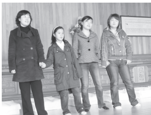
▲ 金老前人外孫媳、曾孫輩合影。