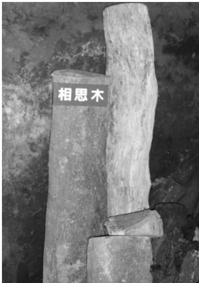
▲ 製作木炭的材料：相思木。