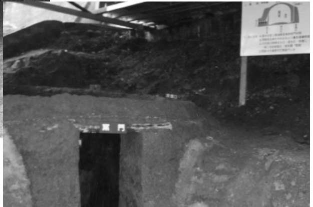
▲ 珍惜資源而興建的古炭窯。