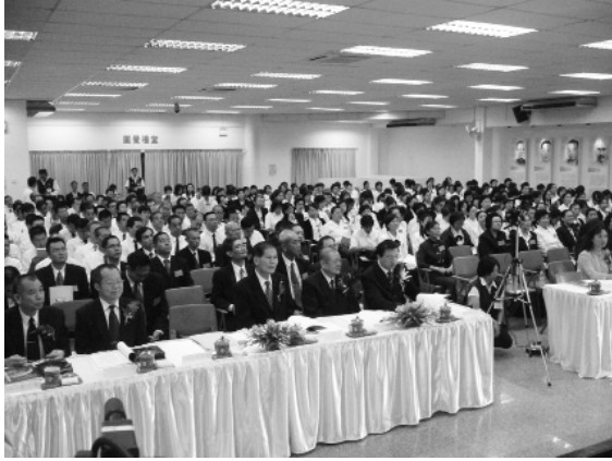
▲學術研討會假圓覺禮堂舉行。