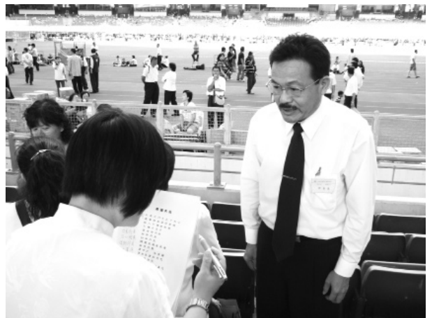
▲ 背誦經典，帶動社會善良風氣。

高教部副部長拿督翁詩傑主持閉幕式說，背誦經典如同國小學生背誦乘法表一般，他們可能不懂當中的智慧，但隨著年紀和閱歷的增長，自然會了解個中精髓，這股帶動中華經典文學的努力必須持之以恆，才能對社會有稱職的作用。