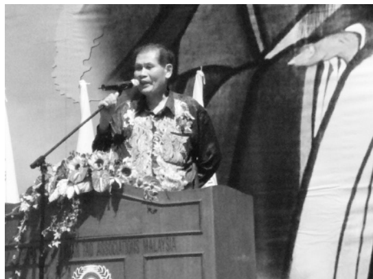
▲ 世總會陳副理事長致詞。

更能將其精神廣泛推廣。中華文化更是傳道明理的最好媒介。因此，貴會配合各方的呼籲與推動，得心應手地成功主辦每一屆的萬人讀經評鑑大會，更透過各國輪辦而效應倍增。一貫道導人向上，淨化社會人心，促進世界大同，是國際華裔一把響亮的聲音。」