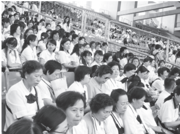
▲基礎忠恕道場考生成績優異。