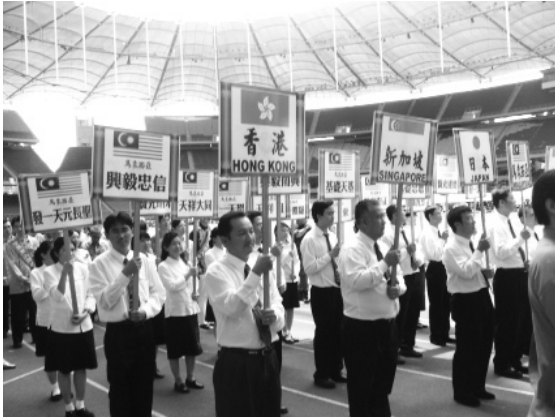
▲來自各國讀經人士參與盛會。

子治家格言說：『讀書志在聖賢。子孫雖愚，經書不可不讀。』要讓後代有高明的智慧，高尚的品德，一定要養成志在效法聖賢的風範，推動讀經教育，是一道正確的法門。」