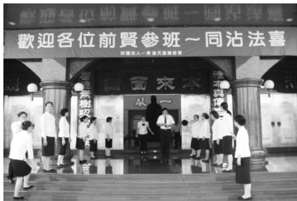
▲ 感恩天皇宮前賢們列隊歡迎。

覓覓，終於在1988年歲末如願以償，於台中縣石岡鄉購得現有土地，並於1990年動土興建，1995年12月24日落成啟用。幾年建設的辛苦，當然不會是區區這一段文字所能表達的，天皇宮的一磚一瓦皆承自皇天厚恩，圓覺大帝德澤，浩浩蕩蕩震撼了全體建德後學的心中，而最後是大德前人用慈悲的水凝聚了所有的一切，完成這座無比莊嚴的道場。感恩之餘，忠恕學院同修們，同感前輩修辦精神的偉大，更當體恤前賢開荒之功，團結一致、真心修辦，以報答天恩師德於萬一。