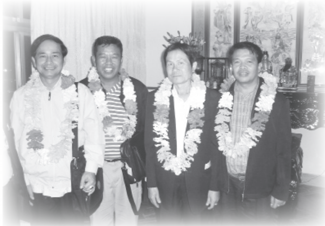
▲ 泰國督學與校長四月來台訪道留影。