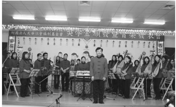
△忠恕國樂團精彩演出。

軍，全校老師犧牲假期、義務來協助，非常有愛心。經與家長會討論後，96年增加論語及成語故事，一到六年級、全校43位小朋友共同讀經