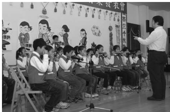
△廣福口琴隊技冠全國。

誠如洪點傳師所言：面臨現代社會少子化、過動兒、過度調皮等現象，讀經教育常用在機會教育中，能讓孩子自我啓發、反省、深思，進而約束自己。廣福國小的讀經推動經驗，非常值得珍惜，並且是更進步的動力，一班、一校、社區讀經，社區與社區交流、鄉與鄉結合，凝聚力量，仿造花蓮、桃園等全縣讀經會考，讀經儼然是全民運動了！