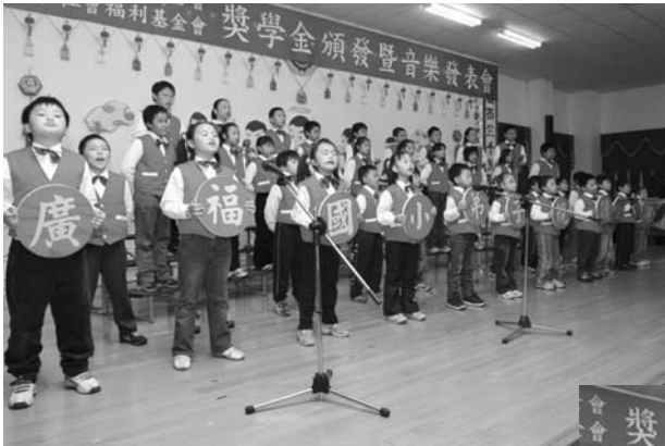
△廣福讀經表演—弟子規。

讀經優良獎學金（過年小紅包），相當有成就感！讀經成果發表非常成功，主要是因為家長支持和老師們平日的督促所致。在南投各學校，讀經風氣普遍悠久，既可發揚中華文化，又能涵養孩子心性，儼然成為全民共識！」