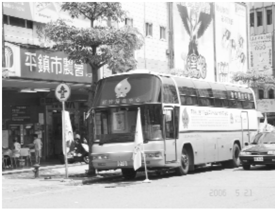
捐血車抵達 NOVA電腦資訊廣場前。

然能給他人帶來希望，又可以讓自己心靈快樂，利人又利己，何樂而不為？朋友們！試試看吧！