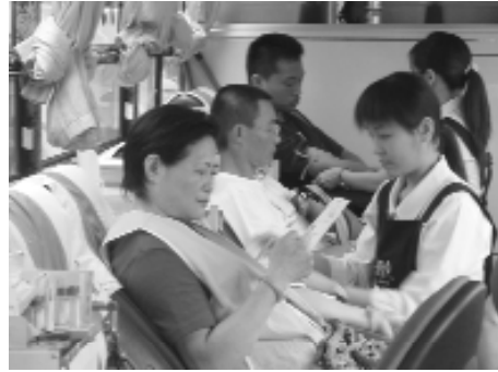
縣支會徐常務理事特來捐血救人。

一袋看似普通的血卻可以救一條寶貴的生命，諸位前賢！您們心動了嗎？心動不如行動，有益的活動需要大家共同來響應！