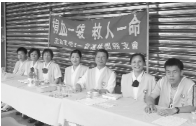
詹理事長（右三）與縣支會志工們合影。

作個免費健檢；捐血最大的好處是可促進血液新陳代謝，讓血液加速更新。雖是小小的善事，但是對於急需輸血的人來說，無異是天降甘霖，既