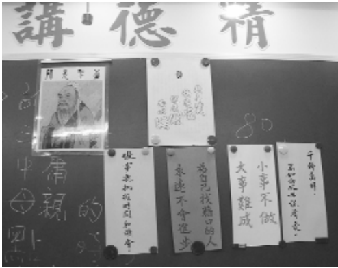
小標語 - 讀經是帶觀念給家長。