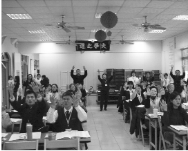
舉辦師資研習相互交流。

興趣、快樂、情感，變得更神奇！當老師遇到瓶頸或困擾時，千萬真的不要放棄，這是長長遠遠的一條有意義的路。我們也有自己的網站（由家長義務幫忙成立），可以連結到發一崇德道場全球資訊網，每天都有三、四百位上來瀏覽，希望有更多人藉此來接觸讀經，有疑問可以在網路上回答交流。平常也為遠地需求而辦理師資研習及講座，盡量推廣在地讀經，並引導師資觀念，如何蒐集資料、整理教案，若有緊急情況我們會南下支援。也在中國青年服務社開班教讀經和講道理，這個暑假，我們預計在自家開青少年讀經班，目標是行為偏差的孩子，這是一般人不敢碰觸的田地，今年要挑戰這一塊領域（真是非常了不起！）。