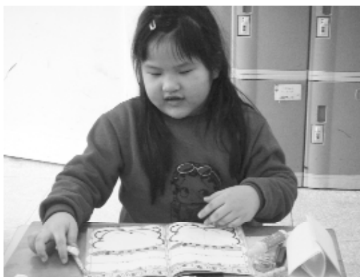
把讀經當成一種生活習慣。

平常即帶動手語歌曲，等到有表演機會，隨時可以上台，這是全班的默契。曾經辦師資成長會，總是告訴夥伴，千萬不要生氣，生氣失了方寸，面對調皮或話多的孩子，容易把做媽媽的心理反映出來，命令式會造成孩子的抗拒，成了教學上的絆腳石。與孩子相處就是要蹲下來，和他一樣大、同理心，用賞識的心理，就知道孩子很單純，好好溝通，他就會跟你做。讀經可以發覺孩子的潛能，有些孩子不敢上台，經過鼓勵，日後