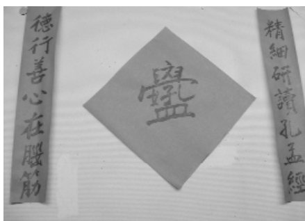
讀經志在孔孟聖道。