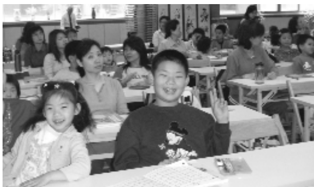
親子讀經一起成長。

死的蟑螂 - - 熱忱不改，有些人教久了技窮，心冷掉就教不下去，千萬不要因為人多或人少，心又動搖；我們不是打不死的蟑螂，而是勇敢的戰士，隨時都在備戰，這股動力是來自輔導的經驗，在孩子身上學到了輔導的經驗，父母要知道孩子的脈動，和他們站在一起。