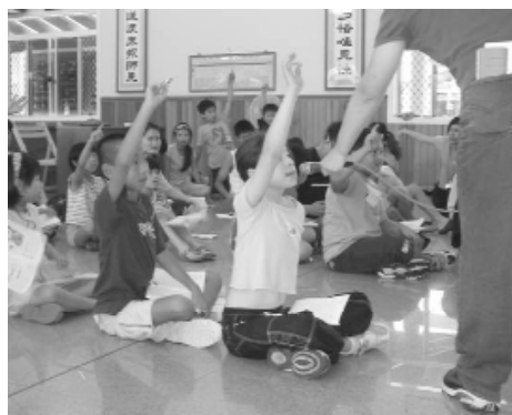
踴躍發言，不落人後。

盼到活動開始，12月16日下午2點，家長陸陸續續將小朋友送到中堂，有的小朋友一下就能夠「如魚得水」一齊和大哥哥、大姐姐及其他小朋友玩在一起，但是也有小朋友從來沒有離開過父母親，和那麼多不認識的人在一起，看到父母親要離開，眼淚就停不住地流下來，抱著父母不放，有些小朋友經過一段過渡期後，