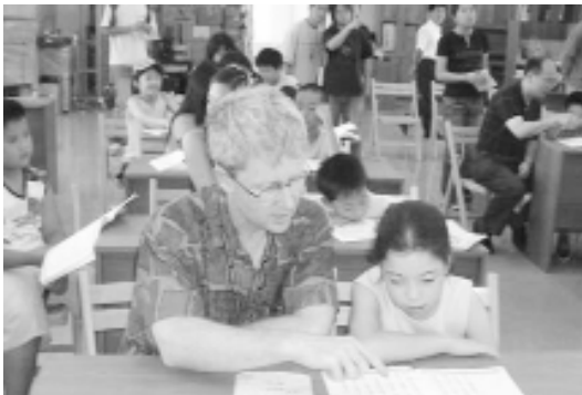
父子讀經，真是不簡單。

也由於我們是新的一群，擁有新的想法、新的觀念、新的處理方式，也將會有新的改變，而這份信心與毅力也就是讓這次活動能夠順利圓滿完成的主要原因之一。例如活動前 2 個月，都沒有接到任何報名的消息，大家就開始懷疑活動是否能夠辦得起來，有人建議到小學門口發傳單，因為這樣的行徑在澳洲很少有，也因此引來側目，雖然成效不佳，但我們都願意去嘗試，在澳洲辦活動，宣傳很重要，因此就在中文報紙上登上有關活動消息，並在各中國超商得到店家的同意後，在店裡的玻璃窗上打起忠恕道院的廣告。為了讓更多人能夠知道消息，還發動忠恕道院的道親以口口相傳的方式去邀請親朋好友、左鄰右舍的小孩，只要