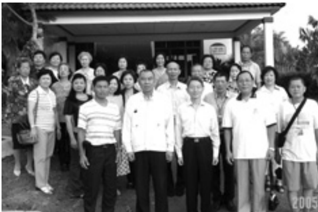
△福爾摩莎度假村合影。

物園，當我們被關進車籠的一刹那，感受了自由的可貴，雖然有安全防衛（鐵籠罩住），仍要叮嚀頭手勿伸出外面，看訓練有素的動物表演，雖