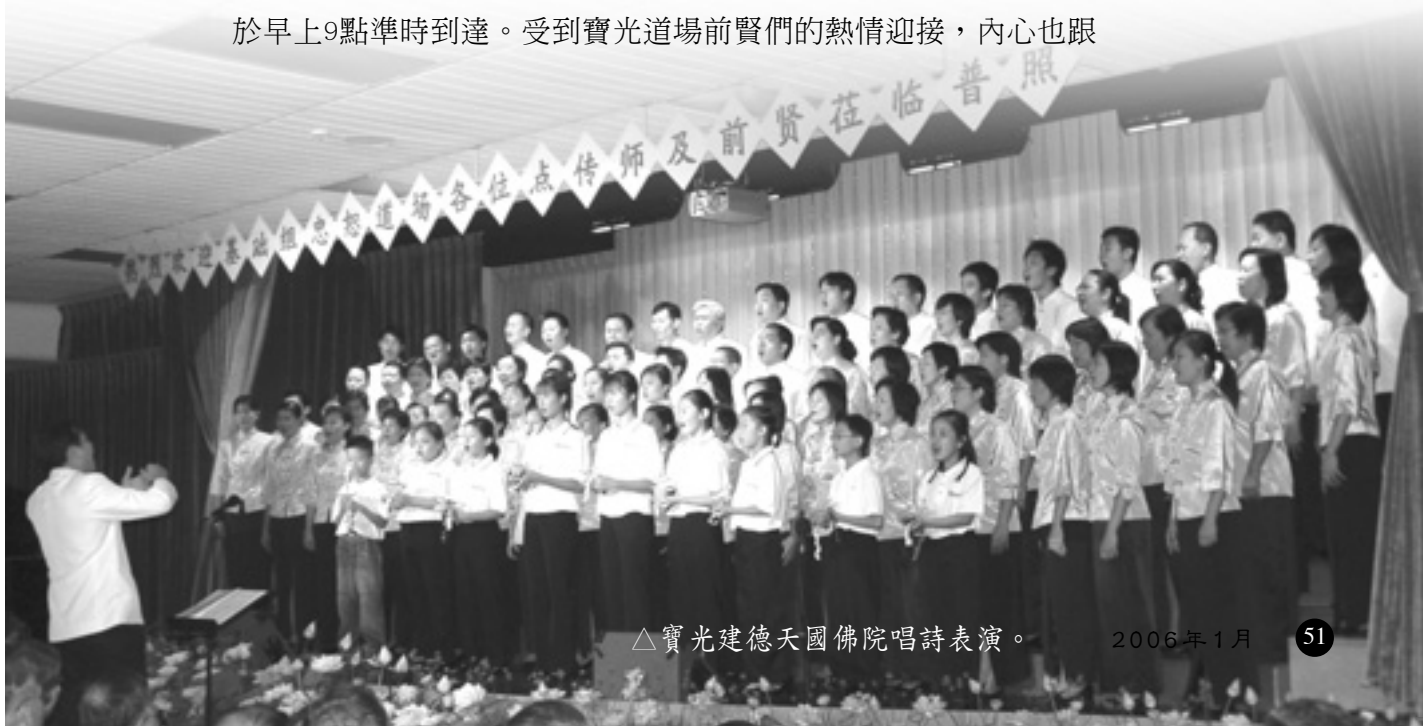
△寶光建德天國佛院唱詩表演。

10月2日參訪重要的一站「新加坡寶光建德天國佛院」，雖然一早歷經馬來西亞、新加坡海關的繁瑣手續，學長們仍然精神抖擻，於早上9點準時到達。受到寶光道場前賢們的熱情迎接，內心也跟