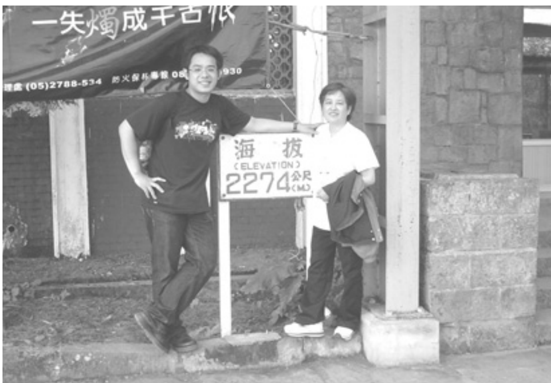
△年輕真好，修道趁早。

親今年約五十，假設我們都活到八十歲，那我還要活多我母親一倍的歲月，若我不修道，就必需多受我母親一倍的痛苦和人生無常；若我現在就開始修道，我就比我媽媽多賺三十年逍遙自在的人生，所以只要我們的數學程度尚可，就知道年輕人一定要修道。二、我們的社會比過去更亂，人所承受的精神壓力與日俱增，有專家學者指出到西元二〇五〇年，精神病患者佔先進國家的比例將高達百分之七十，所以除非我現