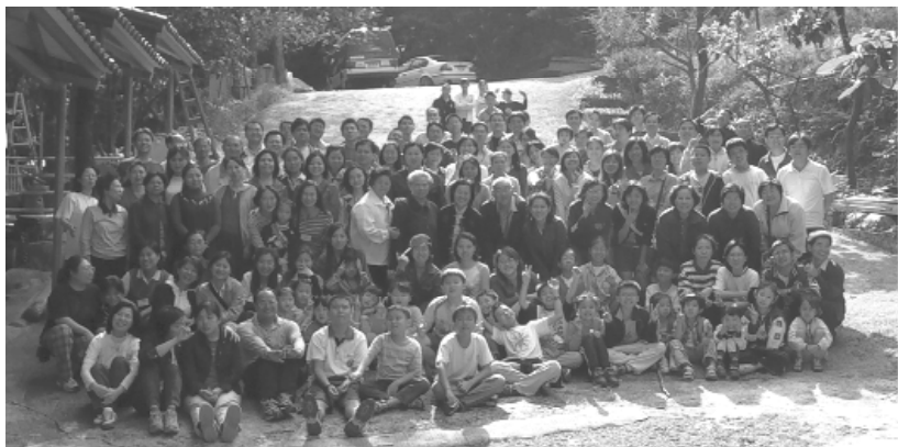
彌勒大家族的開懷笑容。