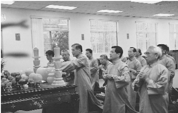
法會於隆重的請壇禮中展開。

添脩點傳師賜導之「基礎忠恕的原由」。忠是竭盡心力做事，恕為寬宥。做為彌勒弟子，我們要對彌勒之旨意，一心奉行，決無退轉。我們要愛人、助人，以眾生為己念，以