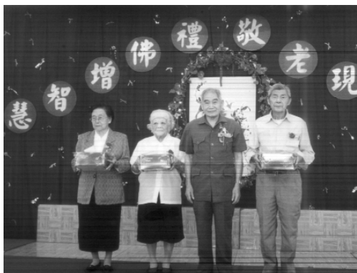
連前人（右二）頒發重陽敬老紀念品。

身體柔軟如綿，面帶微笑，此乃真修有德者之瑞相。 前人個性敦厚納言，謹言慎行，一生廉儉養德，培功立德，他奉行尊師重道的精神，勇於承擔，時刻以救渡眾生為己任，並且總是戰戰兢兢，為法而忘軀，以自身來示道。如今回顧前人生平種種，一切夙昔言行德止，除了讓後學們追思懷念外，更足立為道中不朽之典