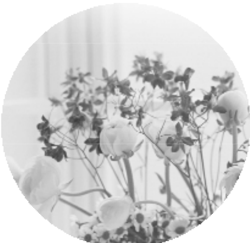
樂道忘軀的劉點傳師。