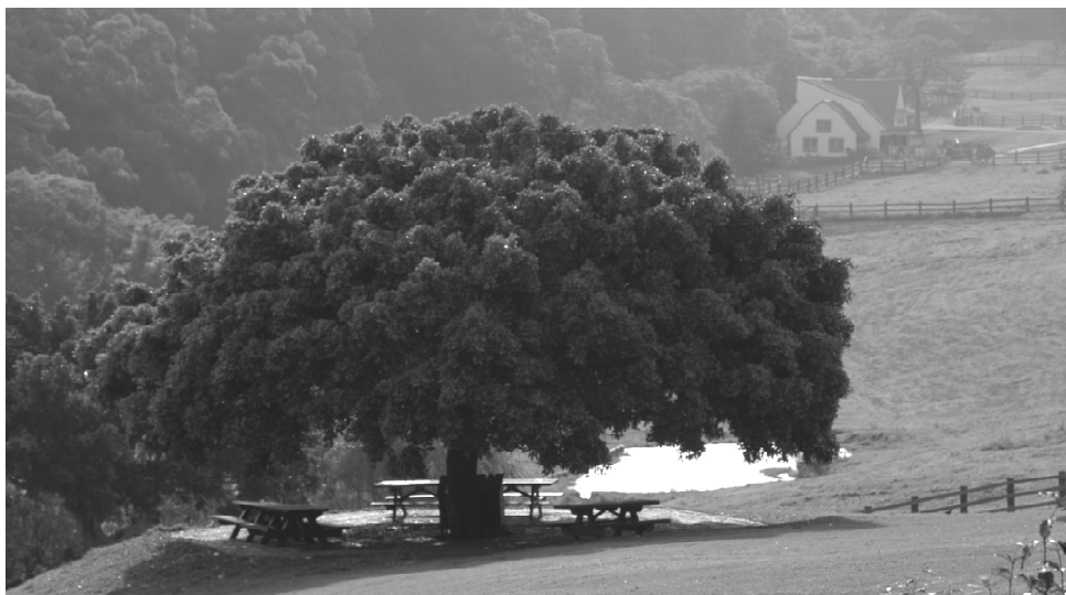
清晨的飛牛牧場令人忘憂。