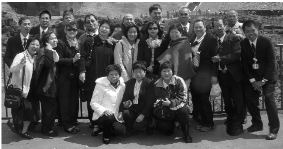
文化知性之旅—大道之尖兵。

前人輩、前賢們當初隻身來台為道披荊斬棘，所吃的苦又算什麼呢？但為道無盡付出，永不動搖的精神，是後學們望塵莫及。