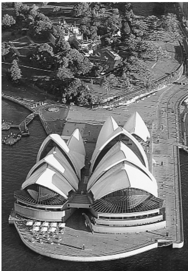
全世界造價最昂貴的雪梨歌劇院。