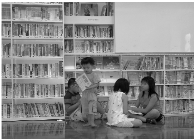
圖書館培養孩子們閱讀的好習慣。