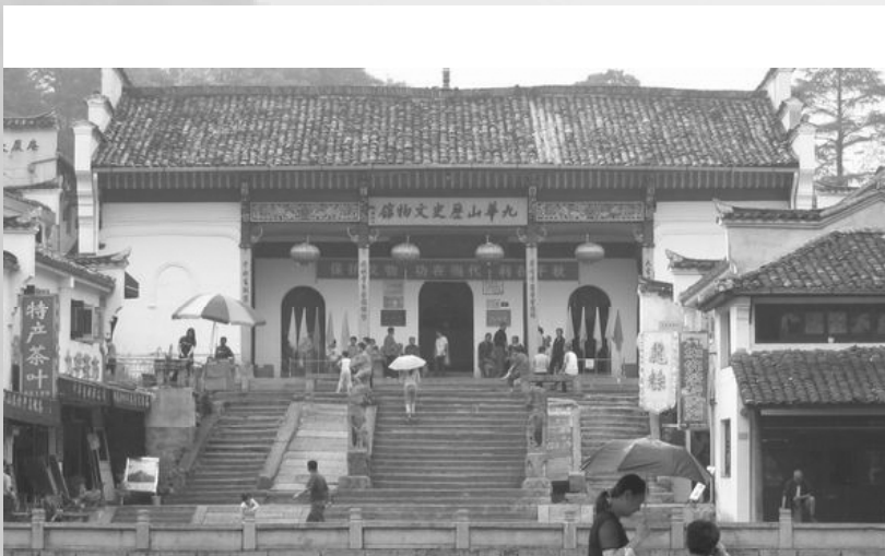
九華山歷史博物館一景。

站。馬不停蹄轉乘大巴至青陽縣，因為車子超載，不久就在高速公路被公安攔截了下來，耽擱了好一陣子之後，才轉往省道繼續行駛，到了青陽縣已是過了晌午。烈日無情，四十一度的高溫，沒有一點風，也沒有樹蔭，曬得人皮膚毛孔內的水份流失快要