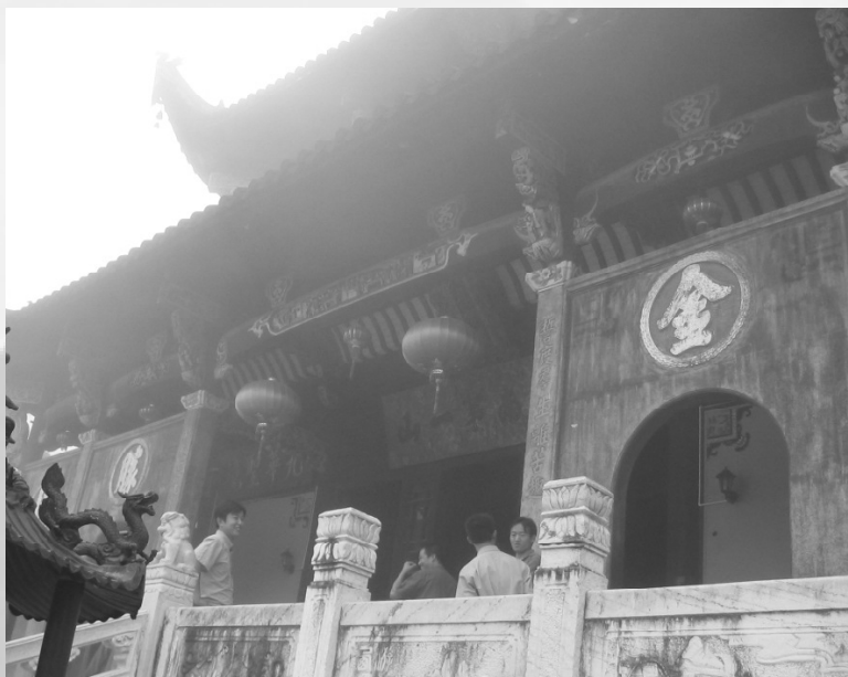
九華山遍佈古剎廟宇，香火不絕。

別九華山，無法休憩片刻，於是快步走到肉身殿。在唐貞元十年（公元七百九十四年）金喬覺九十九歲，趺跏示寂，其肉身置於函中，經三年不腐，僧眾視為地藏菩薩示現，即在出現「圓光如火」之地，建一後塔來供奉肉身，嗣