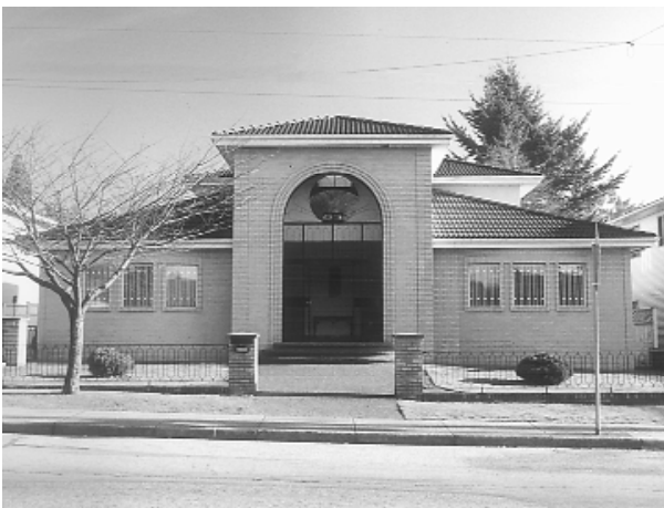
溫哥華明華道院外觀一景。