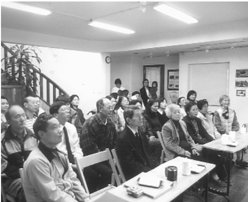
溫哥華明華道院開班情形。

有從事素食食材製作的工廠；後學遙想當年老人、前人輩們放棄一切到台灣來開荒闢道、渡化眾生，當時的處境及心情似乎也在這位點傳師的身上嗅出幾許的味道來；加國的第一晚，就在兩位點傳師的一問一答間悄悄地溜過。坐在一旁的小後學我直想：原來天將降大任於斯人，不但是要餓其體膚、空乏其身，還透過許多來自內心及外境的境緣在驗證