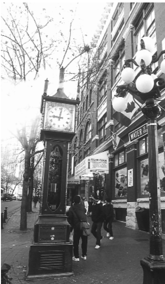
溫哥華港邊之蒸氣鐘。

道院的內外環境及晚上開班前的準備工作，坤道學長則在廚房準備晚上晚餐，每位都準備幾樣拿手好菜分享大家，而這一切都是本地道親自發性的，廚房內笑聲、問候聲不斷，讓人感覺到只要有道的地方，都是人間的天堂所在、彌勒家園的人間示現；真的，都好看美，無論是台灣或是海外道場都無有差別。其中最令後學感