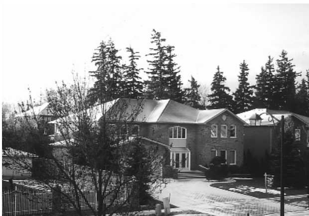
多倫多明華道院鄰居雪景。

酸血淚，往往都融在充滿笑顏的後面，只是身為辦事員的我們可曾真正分擔過點傳師們肩頭的重擔？猶記得辦事員愿中有這麼一段「承繼祖師宏慈大愿：達成師尊師母二老大人普渡心法，佐助點傳師道務檢討及策劃，尊前提後作前賢與後進間的橋樑：」憶起曾聽過道